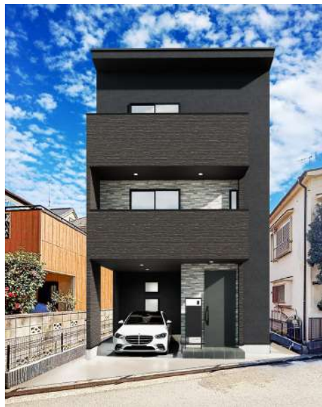
【CGパース】 ※パースはイメージ画像のため、実際と多少異なる場合がございます。 絵中の車や家具等はは配置例を示したもので販売対象には含まれません。