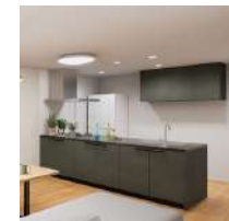
フル収納タイプ(キッチン)ひと坪パントリー(食品庫)