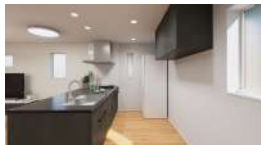
キッチン完成予想図