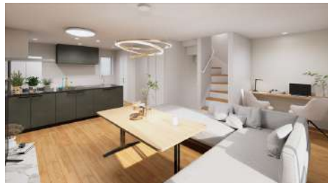
リビング完成予想図