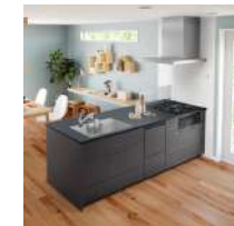
フラット対面カウンター