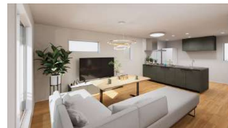
リビング完成予想図