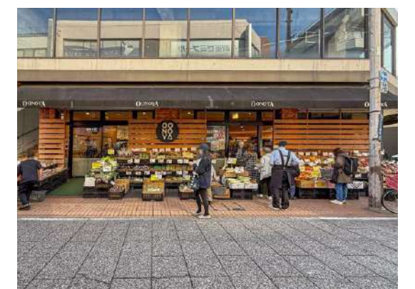
大野屋 元住吉店 約110m

Dealings in real estate SELECT WWW.shinmaruko.com