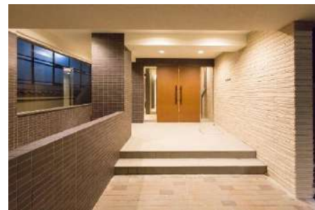
共用エントランス