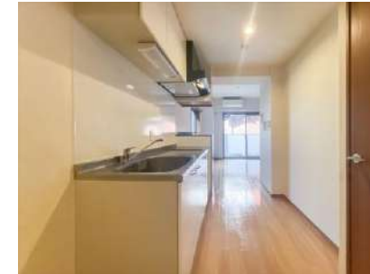
キッチンスペース