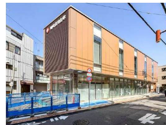
東急ストア 約60m (2026年初夏開店予定)