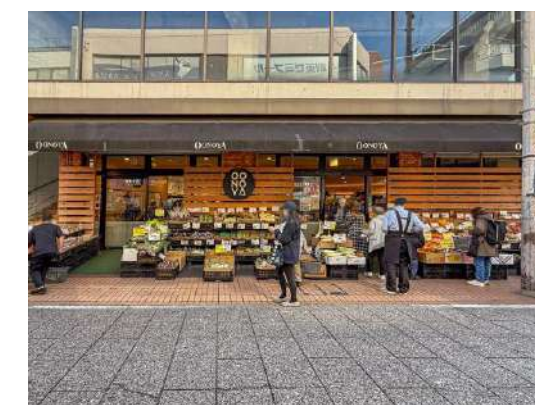
大野屋 元住吉店 約110m

Dealings in real estate SELECT WWW.shinmaruko.com