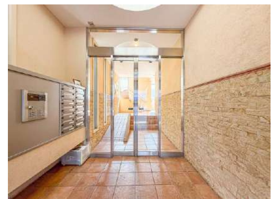
エントランスホール(オートロック)

※ 図面と現況が異なる場合は現況を優先させていただきます。 ※ 掲載している画像は実際の部屋ではございません。(6階部分:同仕様)