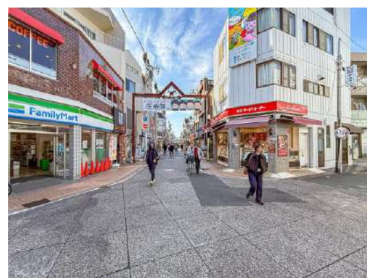
モトスミ・ブレイメン通り商店街 約40m