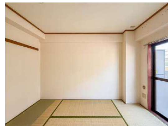
和室 約 6 帖