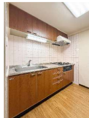
システムキッチン(ガス 3 口) キッチンスペース