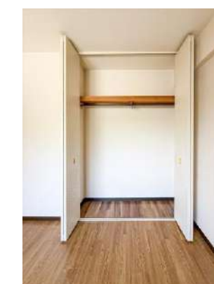
洋室 約 4.5 帖収納