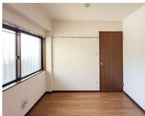
洋室 約4, 5帖