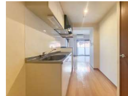
キッチンスペース