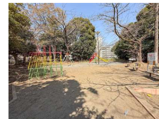
宮崎第一公園 約 100m

Dealings in real estate SELECT WWW.shinmaruko.com