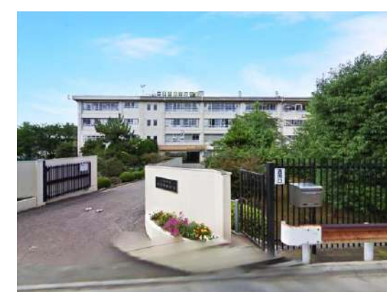
川崎市立宮前平中学校 約 1,100m