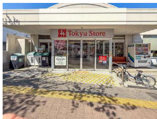
東急ストア宮崎台店 約 300m