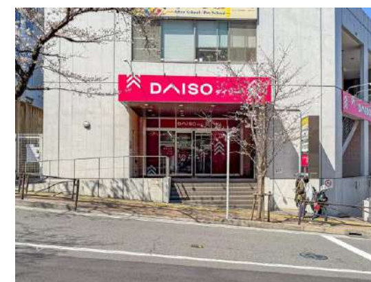
ダイソー トラパス宮崎台店 約210m