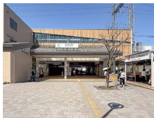
東急田園都市線 宮崎台駅 約 240m

都市ガス/エアコンなし/室内洗濯機置場/シャワー/追焚なし/ 脱衣所/独立洗面/バルコニー/クローゼット/下駄箱/エレベータ