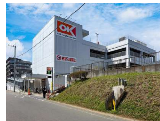
オーケー宮崎台店 約 350m