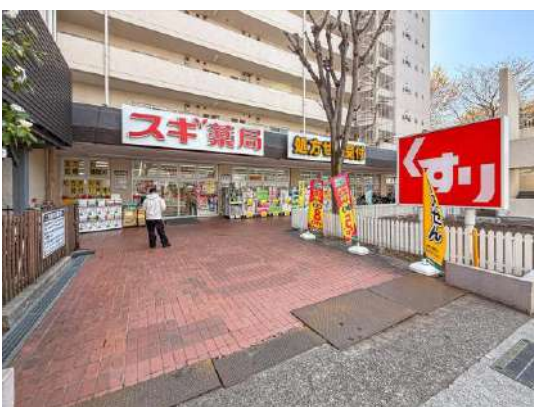
スギ薬局調剤宮崎台 約 180m