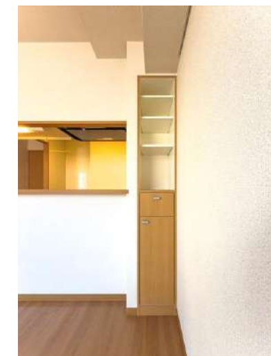
リビングカウンター横収納