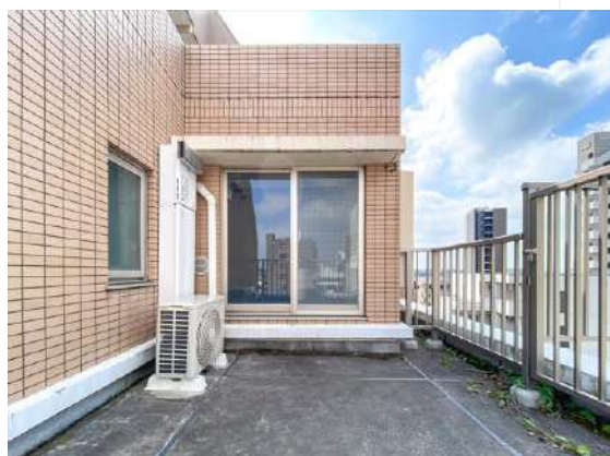
ルーフバルコニー