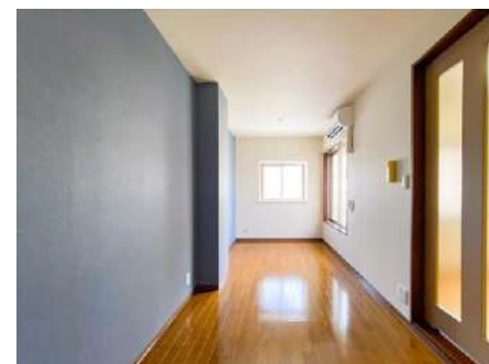
洋室 約 6.6 帖