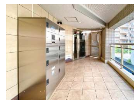
エントランス(宅配BOX)