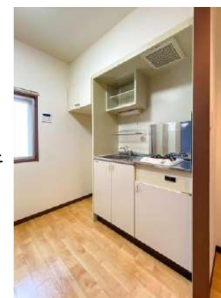
システムキッチン(ガス1口) ユニットバス(浴室乾燥機)