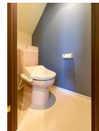
トイレ(温水洗浄便座)