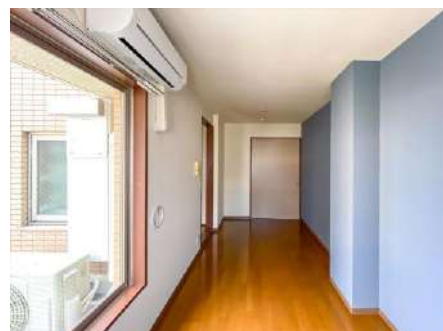
洋室 約 6.6 帖