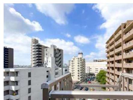
ルーフバルコニー眺望