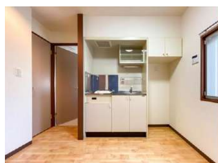
キッチンスペース