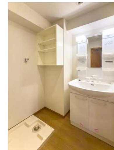
洗面台・棚・洗濯機置場