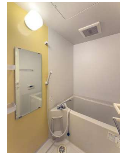
ユニットバス(追炊き)