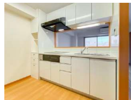
システムキッチン(IHヒーター3口)