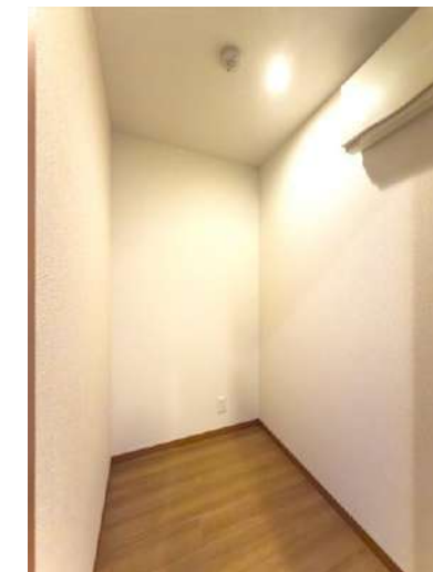
ユーティリティルーム