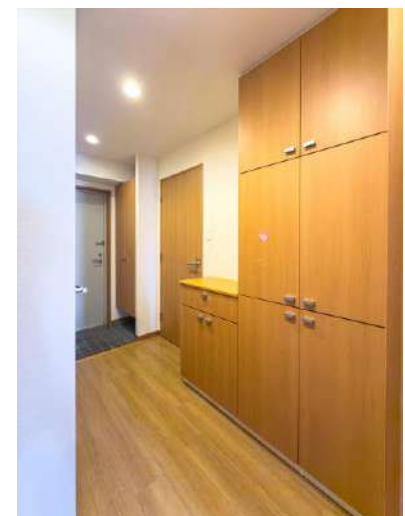
廊下 カウンター収納