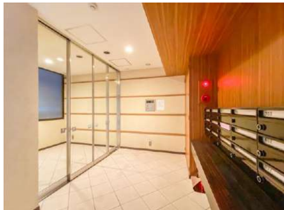
エントランス(オートロック)