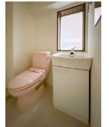
トイレ(温水洗浄便座)

Dealings in real estate SELECT www.shinmaruko.com