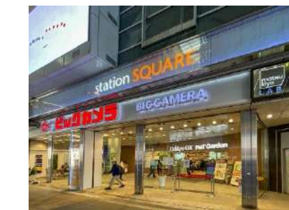
相模大野ステーションスクエア

※ 図面と現況が異なる場合は現況を優先させていただきます。 ※ 画像は前回募集時に撮影。(参考画像)