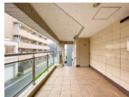
共用エントランス