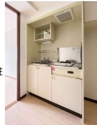
システムキッチン(ガス1口)