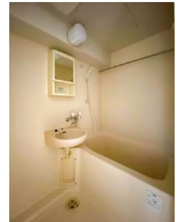
ユニットバス(浴室乾燥機)