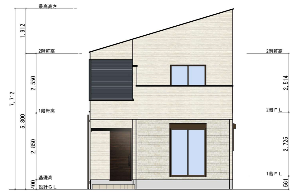
西側 立面図 S:1/100