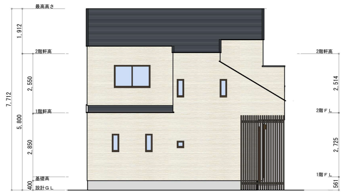
北側 立面図 S:1/100