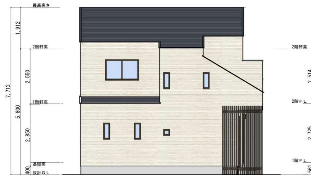
北側 立面図 S:1/100