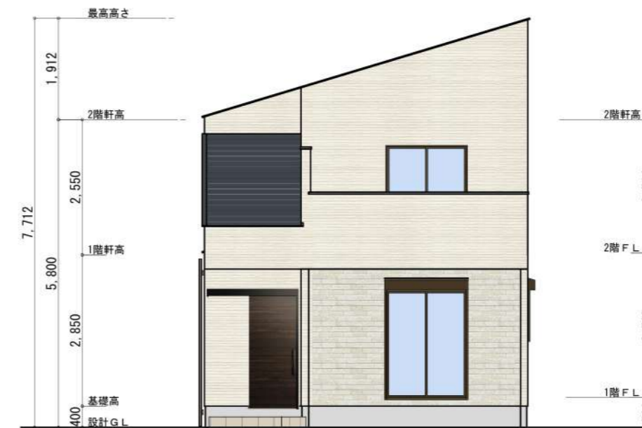
西側 立面図 S:1/100