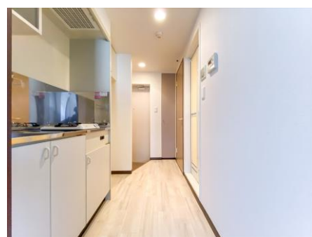
キッチンスペース