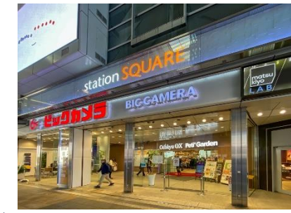
相模大野ステーションスクエア

※リフォーム予定 エアコン新規交換・温水洗浄便座新規交換 クロス貼替・水まわり及び玄関CFシート新規張替