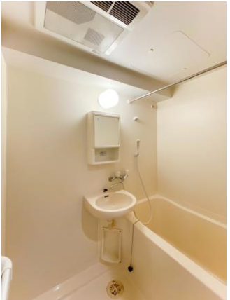
システムキッチン(ガス1口) ユニットバス(浴室乾燥機)