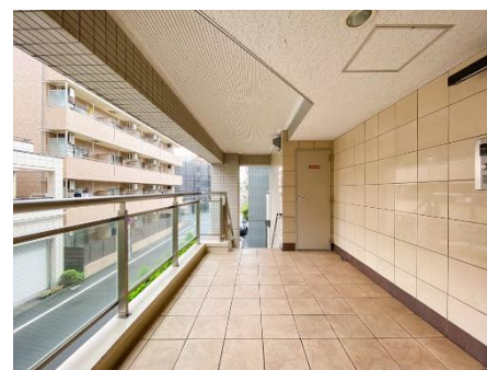
共用エントランス