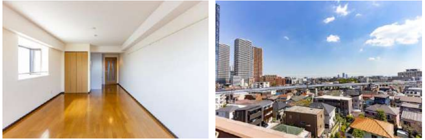
洋室 バルコニーからの眺望