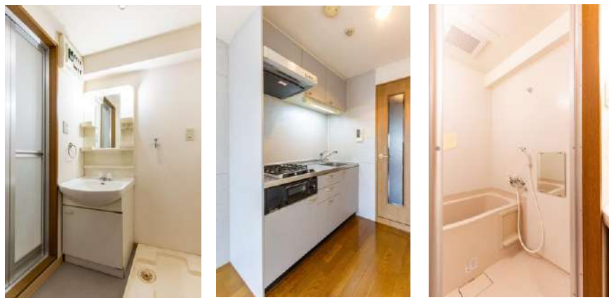
独立洗面台 システムキッチン 浴室