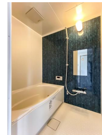
ユニットバス(追炊き)