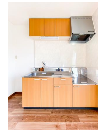
キッチン(ガス持込)

ユニットバス・洗面台・トイレ・キッチン(ガス持込) 新規交換! 床フローリング新規貼り替え!