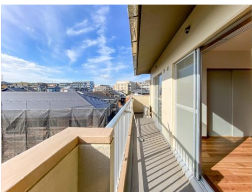
バルコニー側2面の窓から採光