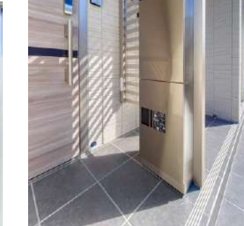
専用の宅配ロッカー&ポスト