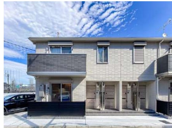
建物外観 全部屋(12世帯)南西向き