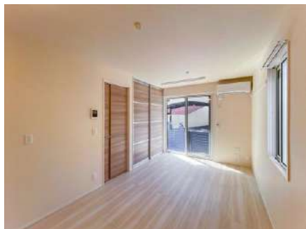
洋室 約9.2帖 (区切りのない間取が使いやすい)