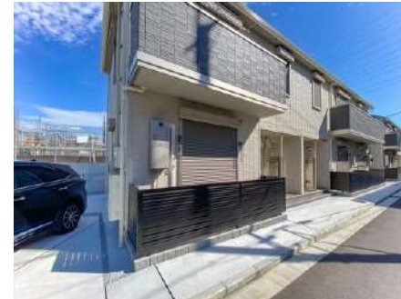
バルコニーシャッター付窓