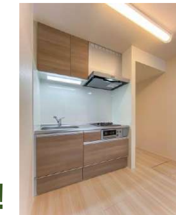
システムキッチン(ガス2口) ユニットバス(浴室乾燥機)