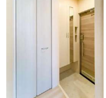
玄関収納・下駄箱