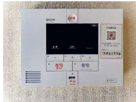
セコムホームセキュリティ(無料)