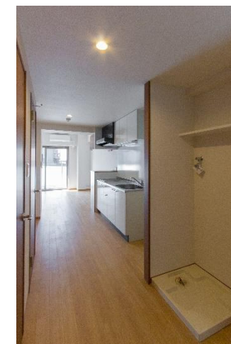
洗濯機置場 (反転タイプ)