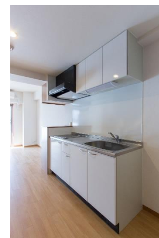
キッチン IH (2口)