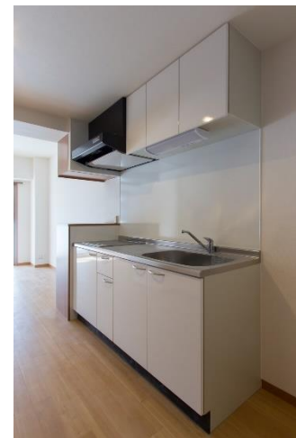
キッチン IH (2口)