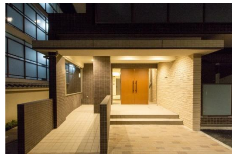
エントランスホール (オートロック)